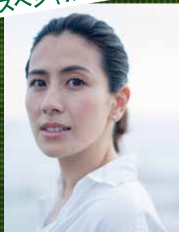
長谷川理恵さん トークショー& WabiYoga